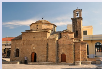
Η ιστορική εκκλησία των Αγίων Αποστόλων

Α. Πολυδώρου Γ. Τζίφα Ε. Χατζηδάκη Ζ. Χουσιανίτης